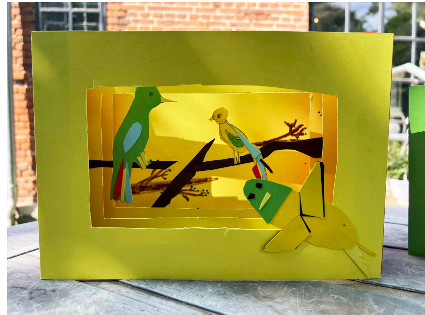
KJKGG: Projekt „Pop Up in Ganzer“

Antragstellung: https://kumasta3.buendnisse-fuer-bildung.de